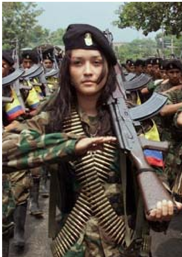
Combatiente de las FARC

La participación de la mujer en la revolución socialista en México es un hecho de importancia trascendental, porque cuando se generalice su participación habremos podido romper juntos las cadenas que la atan en el sistema capitalista.