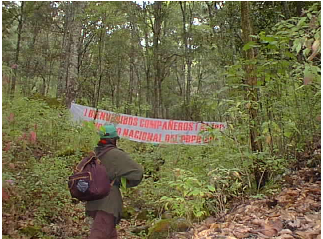
Compañera combatiente del PDPR-EPR a su llegada al primer congreso de nuestro partido

ejemplos como estos hay de sobra, mujeres que han dado la vida por la liberación de nuestro pueblo, es por ello que ahora nos toca a nosotras seguir esos ejemplos y alzar la voz, pero no contra los hombres sino contra el sistema que al igual que nos oprime a nosotras de la misma forma lo hace con los hombres, debiendo luchar juntos contra los explotadores que al igual nos oprime y explota por igual.